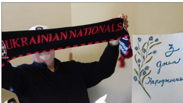
Митрополит Стефан показав подаровані шалик, шапку та іншу футбольну атрибутику.