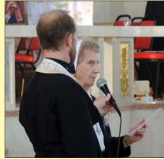
Сестер святого Василя Великого