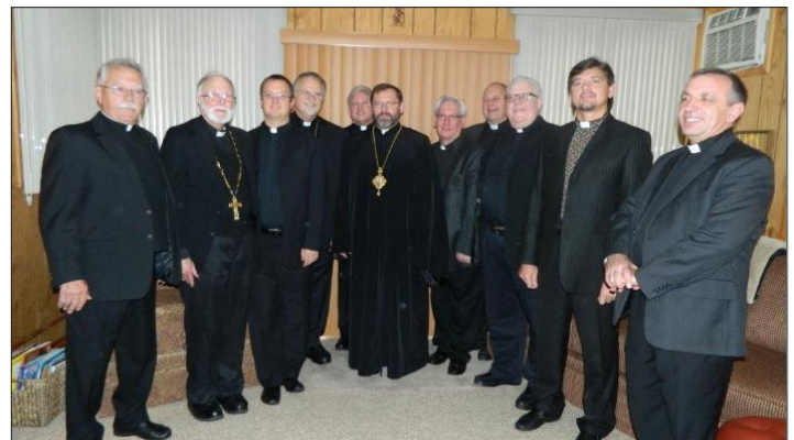
His Beatitude Sviatoslav poses for a picture in Minersville, PA.