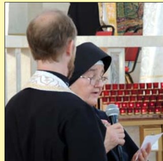
Сестер Місіонарок Покрову Божої Матері