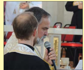
Отці Чину святого Василя Великого