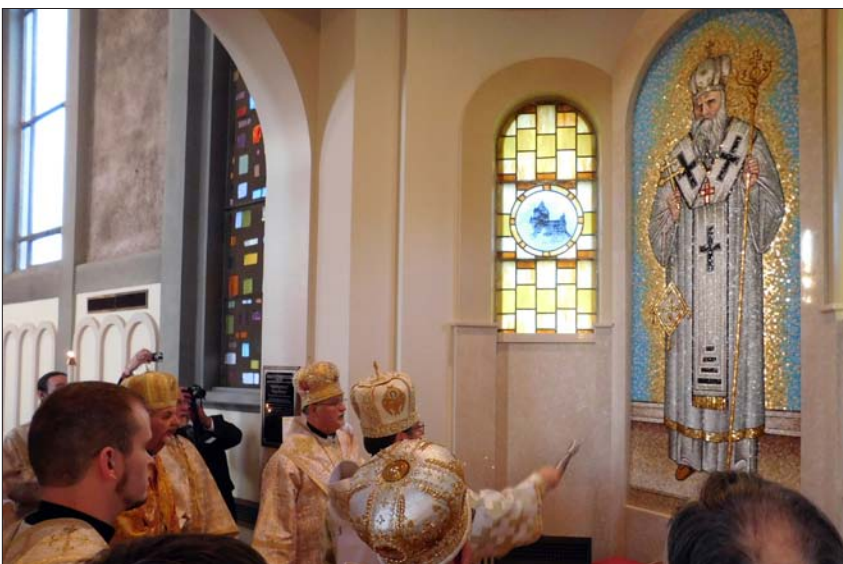
Посвячення нової мозаїки Слуги Божого Митрополита Андрея Шептицького.