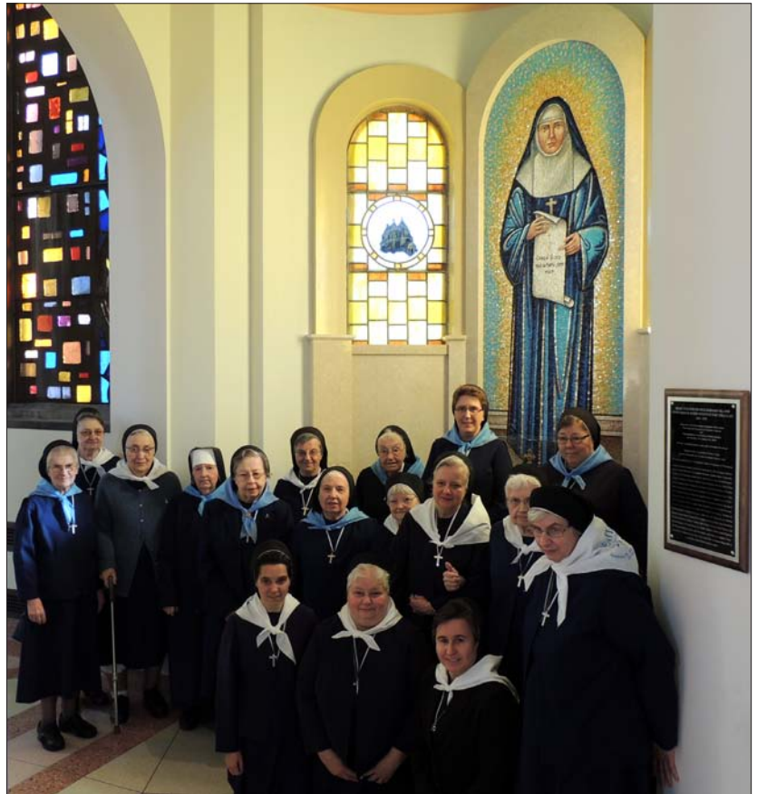
Sister Servants pose for a picture with the Mosaic of Blessed Josaphata Hordashevskia, SSMI