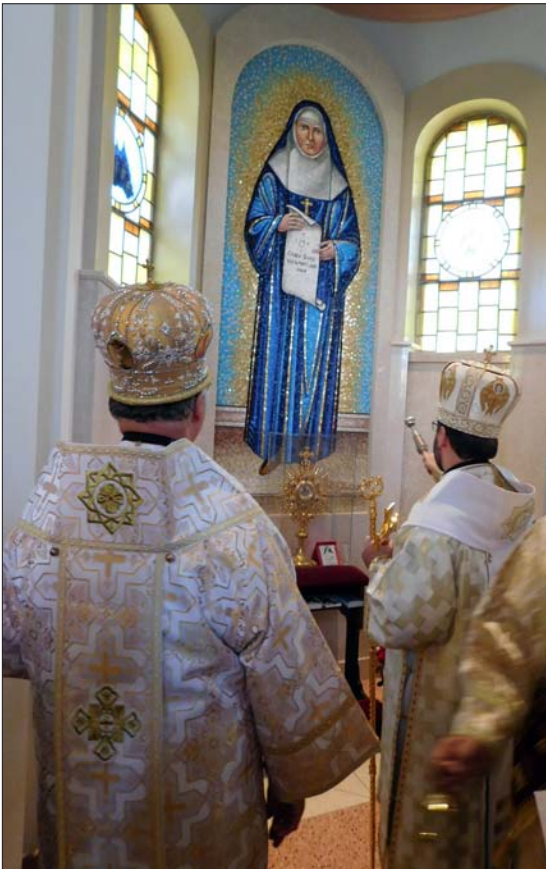
Посвячення нової мозаїки Блаженної Йосафати.