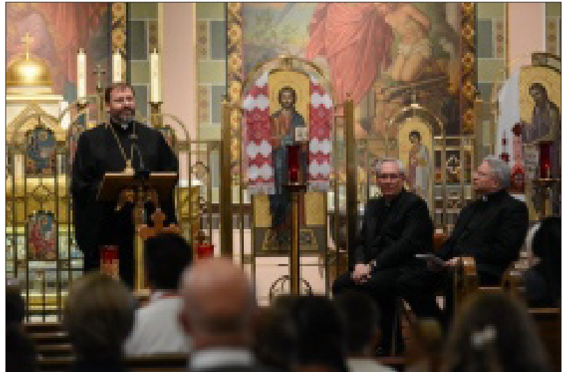
His Beatitude Sviatoslav Shevchuk speaks at St. Nicholas Ukrainian Catholic Church, Minersville on November 10, 2015.

Майнерсвілл - У вівторок Патріарх Української Греко-Католицької Церкви відвідав українську католицьку церкву св. Миколая в Майнерсвілл і зустрівся з дітьми парафіяльної школи.