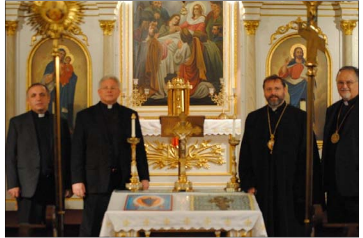
Assumption of the Blessed Virgin Mary Church, Centralia, Pa.