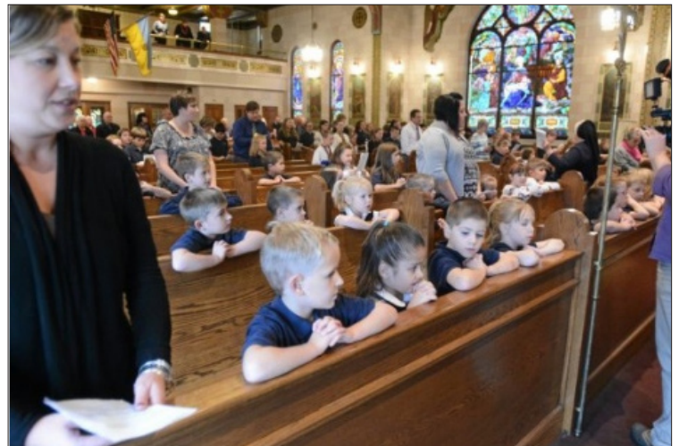
St. Nicholas Ukrainian Catholic School students sing for His Beatitude Sviatoslav Shevchuk during a visit on Tuesday, Nov. 10, 2015 in Minersville.