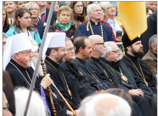
Listening to speeches during the ceremony.

Watch videos on our You Tube Channel at https://www.youtube.com/user/thewayukrainian/videos