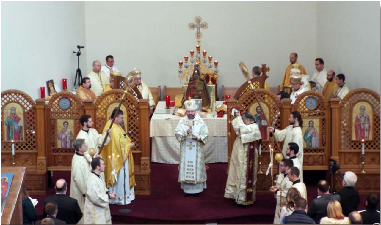
His Beatitude at Ukrainian Catholic National Shrine of the Holy Family in Washington, DC.