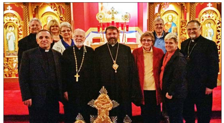
St. Michael's in Shenandoah, Pa.