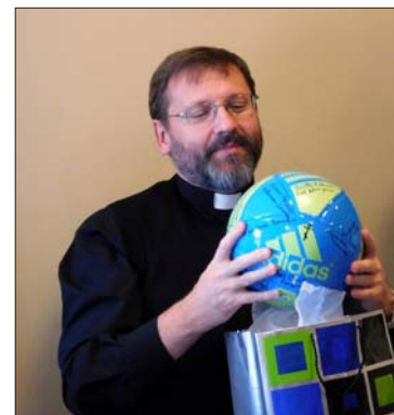
Блаженнішому Святославу подарували і синьо-жовтого м'яча розписаного побажаннями всіх працівників канцелярії. Блаженніший зізнався, що ніхто йому м'яча ще не дарував.