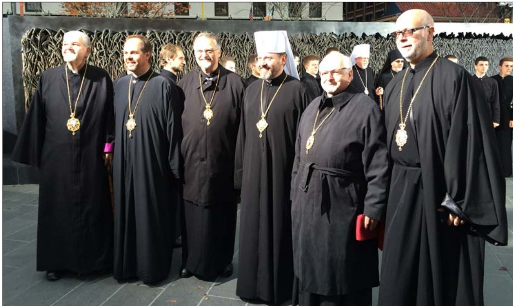
Блаженніший Святослав разом з іншими Владиками коло Меморіала Голодомору у Вашингтоні.