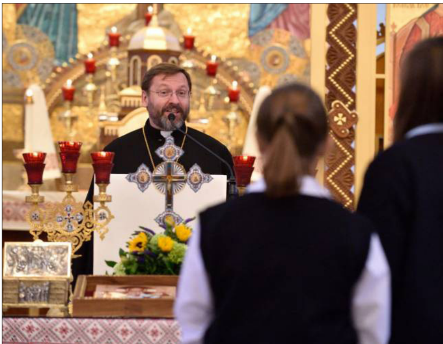
Блаженніший Святослав Шевчук, Патріярх Української Греко-Католицької Церкви, говорить з дітьми і вчителями в Церкві св. Миколая в Пассейку, четвер 12-го листопада 2015 р.

Після візиту до Вашингтону, Блаженніший відвідав Пассейк. У Вашингтоні Патріярх Святослав зустрівся з членами адміністрації президента Обами, пробуючи заручитися їхньою підтримкою у збільшенні гуманітарної допомоги Україні.