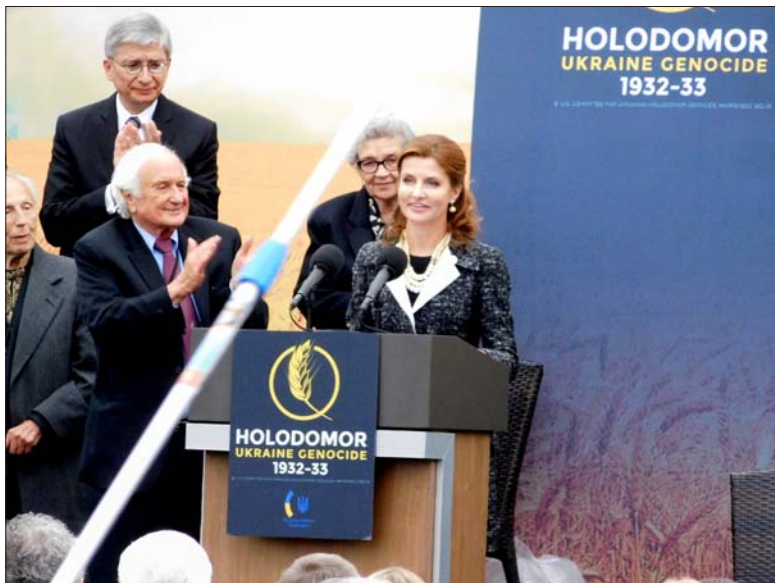
President's wife Maryna Poroshenko delivered a speech at the opening of the Memorial to Victims of Holodomor in Ukraine in 1932-1933 in Washington.

http://www.president.gov.ua/news/zhodnim-liholittam-ne-zdolati-nash-narod-prezident-pro-vidk-36266