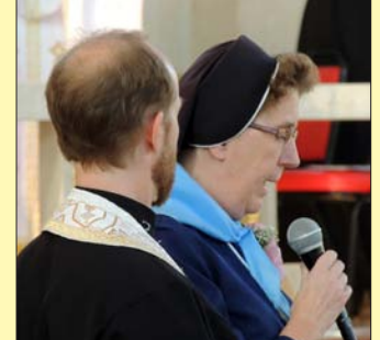
Сестер Служebниць Непорочної Діви Марії