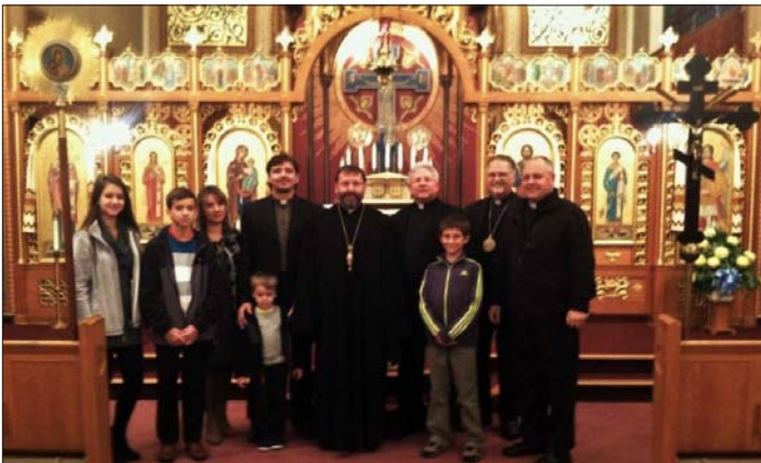
His Beatitude visits St. Michael's Church in Frackville, Pa. On the right of the picture is the original cross from the Dedication of the original St. Michael's Church from 1921.