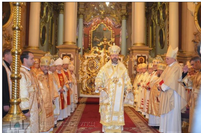
Митрополит Стефан серед єпископів на фото справа.

Під час проповіді Блаженніший Святослав звернувся з вітальним словом і до української молоді. Адже саме цього дня до собору Святого Юра вперше привезли Хрест та Ікону світових днів молоді (СДМ). За словами Першоєрарха УГКЦ, ці реліквії є знаком єдності молоді з різних країн світу. «Українська молодь – надія нашої Церкви і народу», - додав він. Зазначимо, що з благословення владика Ігоря, Архієпископа і Митрополита Львівського УГКЦ, у Львівській архієпархії УГКЦ відбулася проща Хреста та Ікони світових днів молоді. Як відомо, СДМ відбудеться у Кракові (Польща) 2016 року. У цьому заході візьме участь Папа Римський Франциск.