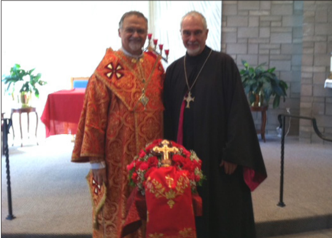
(Фото: Митрополит Стефан і монсеньйор Джордж Епл'ярд)

Long Branch, NJ – З понеділка, 15-го вересня, по четвер, 18-го вересня, священники та диякони Філадельфійської Архиепархії разом зі своїм архиепископом, митрополитом Стефаном Сорокою, зібралися в реколекційному центрі святого Альфонса на свої щорічні духовні реколекції. Реколектантом був монсеньйор Джордж Епл'ярд.