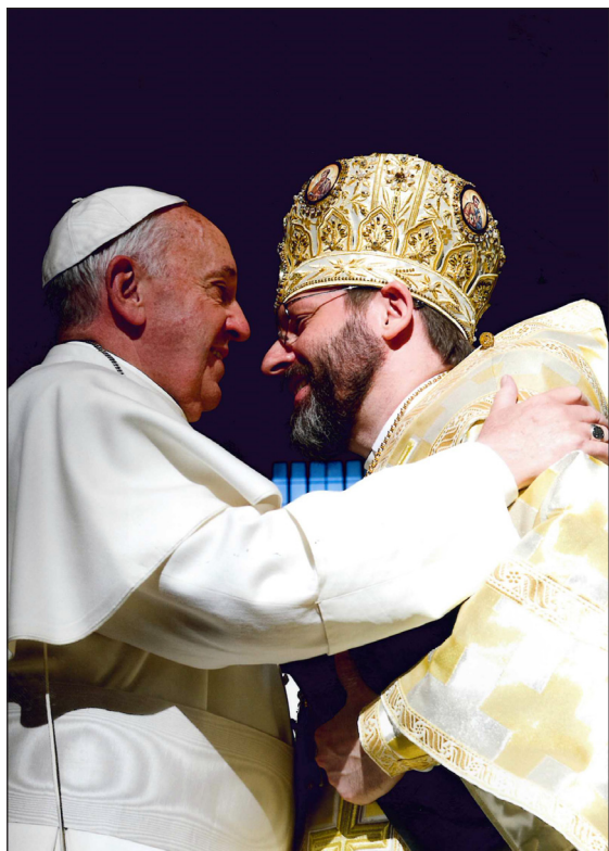
Папа Франциск і Блаженніший Святослав.