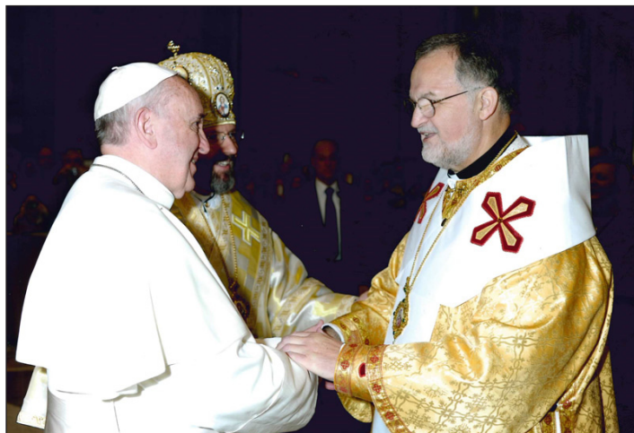
Папа Франциск і Високопреосвященний Стефан Сорока.

Блаженніший Святослав подарував Папі ікону святого Йосафата, а далі відслужив Акафіст до святого священномученика Йосафата.