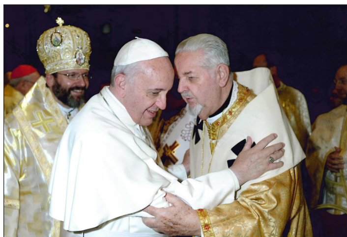
Папа Франциск і єпископ-емерит Василь Лостен.