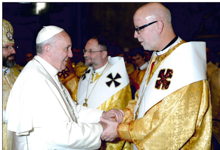
Папа Франциск і преосвященний Павло Хомницький.