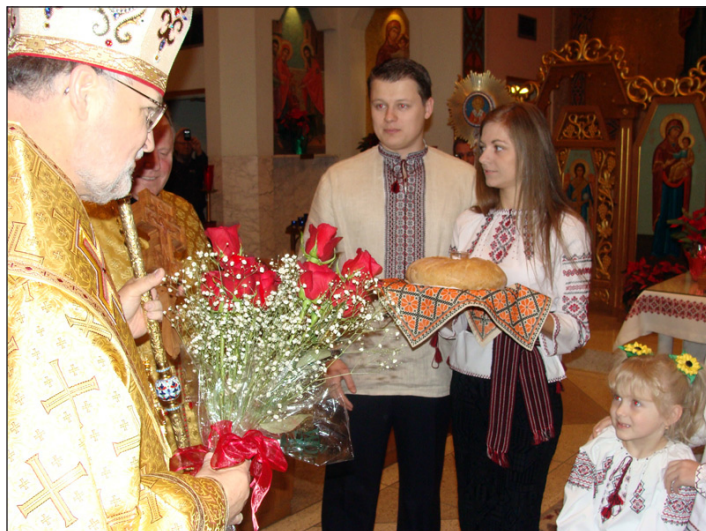
Парафіяльна молодь вітає митрополита-архієпископа Стефана Сороку.