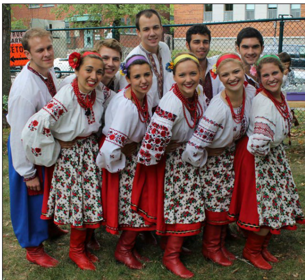
Ukrainian Dance Ensemble Barbarocin from NY.

The Ukrainian Homestead resort is owned and operated by the Organization for the Rebirth of Ukraine, (ODWU). Founded in 1929, ODWU is dedicated to the preservation of Ukrainian language and culture as well as the proliferation of democratic values in the United States and Ukraine. For more information on upcoming events at the Ukrainian Homestead, visit www.ukrhomestead.com