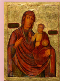
Transcarpathian Mother of God Heritage Galleries of the Eparchy of Passaic (19 th Century)