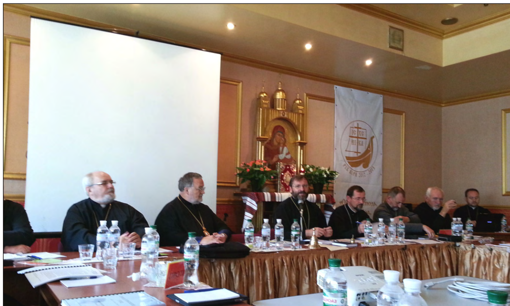
Patriarch Sviatoslav Shevchuk is shown directing the proceedings of the Synod of Ukrainian Catholic Bishops held in Kyiv in August, 2013.

Having just returned from participating in the recent Synod of Ukrainian Catholic Bishops, held in Kyiv, Ukraine, I pause for a quick reflection of the special historical significance of this gathering and celebration held this year. As we commemorated the 1025th anniversary of the Baptism of Ukraine, we initiated a new epoch for our dramatically expanding Ukrainian Catholic Church in Ukraine and worldwide. The newly built Ukrainian Catholic Cathedral of the Holy Resurrection of our Lord and Savior Jesus Christ was consecrated by His Beatitude Sviatoslav Shevchuk on August 18th, 2013, together with all of the Ukrainian