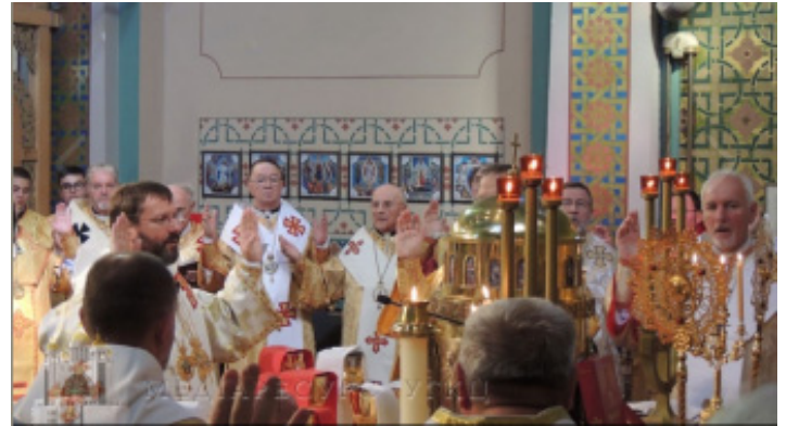
Блаженніший Святослав у Катедрі Свв. Володимира і Ольги в неділю, 9-го вересня 2012 року.