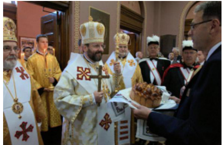
Блаженніший Святослав у Катедрі Свв. Володимира і Ольги в неділю, 9-го вересня 2012 року.