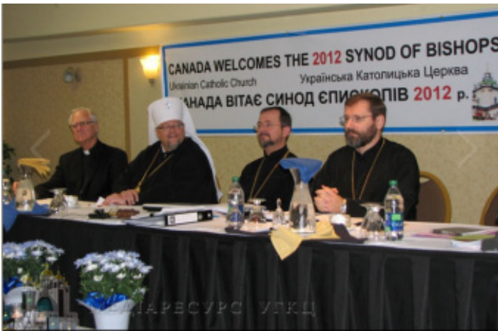
Фото з засідання Синоду Єпископів.