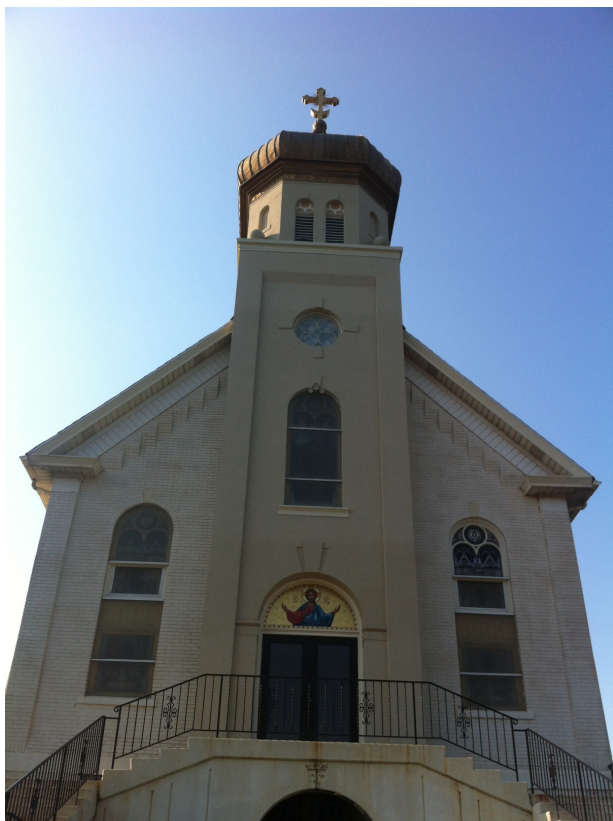
Фасад Української Католицької Церкви Святого Володимира, Palmerton, PA