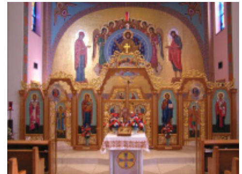
St. Nicholas Ukrainian Catholic Church, Philadelphia, PA