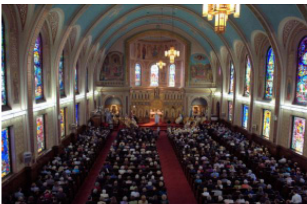
Митрополита Катедра Свв. Володимира і Ольги.