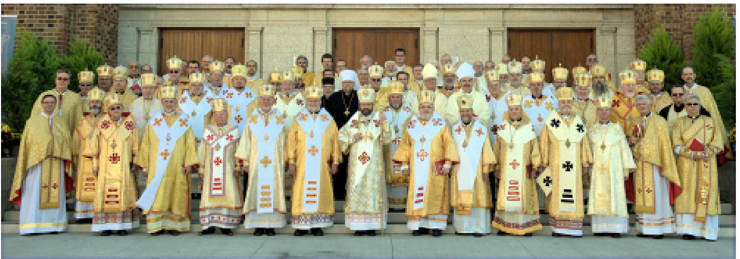
Фото Синоду Єпископів Української Католицької Церкви (і духовенства та гостей архієпископів від Української Православної та Римо-Католицької Церков) які стоять перед Митрополичою Катедрою Свв. Володимира і Ольги у Вінніпезі, Канада перед початком Архисерейської Божественної Літургії, якою офіційно розпочався Синод.

З 9 до 16 вересня 2012 року Божого у м. Вінніпезі (Канада) відбувся Синод Єпископів Української Греко-Католицької Церкви, у якому взяли участь 38 єпископів з України, США, Канади, Австралії, країн Центральної та Західної Європи і Латинської Америки.