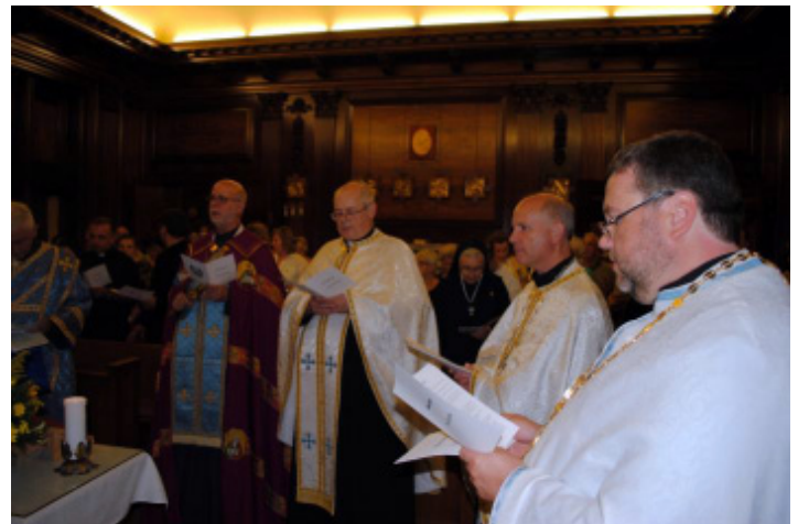
Panahyda on Saturday, August 11, 2012 at St. Mary's Villa Chapel for deceased pilgrims.