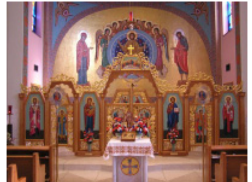
St. Nicholas Ukrainian Catholic Church, Philadelphia, PA