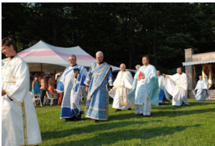
Procession from Moleben on Saturday, August 11, 2012.