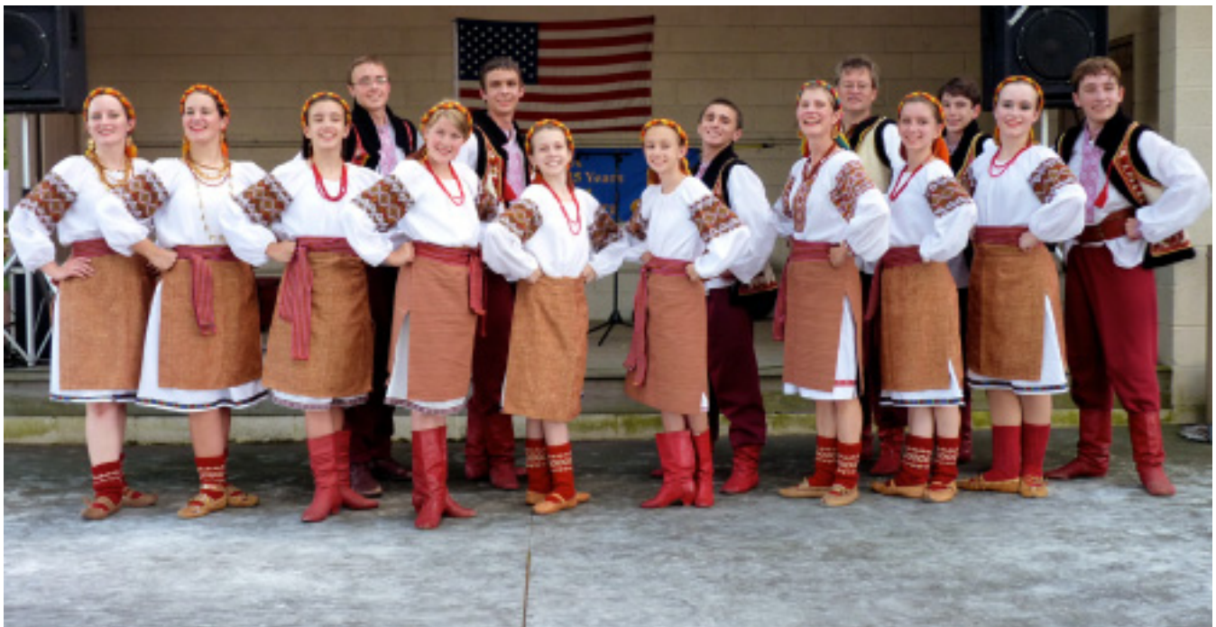
Kazka performing at Ukrainian Seminary Day in Minersville, July 29, 2012.