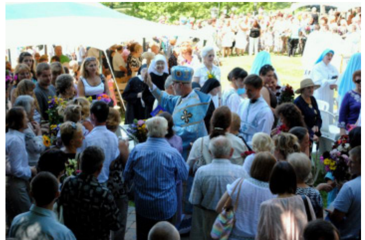
Blessing of Flowers.