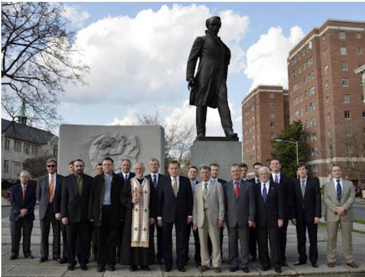
Біля пам'ятника Тарасу Шевченку

13 березня 2012 року з нагоди 198-я від дня народження Тараса Шевченка Посол України в США Олександр Моцик поклав квіти до пам'ятника Великого Кобзаря у м. Вашингтон. У церемонії взяли участь представники української громади Америки та дипломати Посольства.