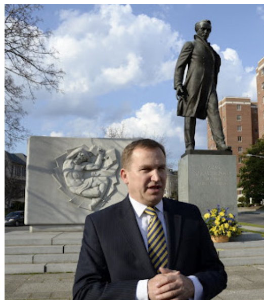
Посол Олександр Моцик на церемонії покладання квітів до пам'ятника Тарасу Шевченку.

Виступаючи перед учасниками зібрання, Посол О.Моцик відзначив важливу роль творчості Тараса Шевченка у відродженні української державності, підтриманні національної самобутності українців у всьому світі, а також вагомий внесок Великого Кобзаря у світову культурно-мистецьку спадщину.