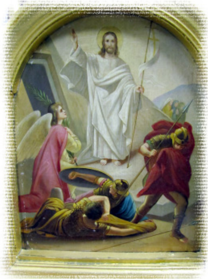
Фото іконостасу, пожертвованого Українською Католицькою Церквою свв. Петра і Павла, в Плимут, Пенс., що знаходиться в музеї „Скарб віри” в Філадельфії, Пенс. За більш детальнішою інформацією про музей телефонуйте 215-627-3389 або e-mail tofmuseum@catholic.org .

самий Христос, який упокорився до вільного прийняття страждань і смерті на хресті, зараз живе у повноті людського життя. Святий Павло говорить про Ісуса, який жив для Бога! Його людська природа перебуває в сьайві життя.