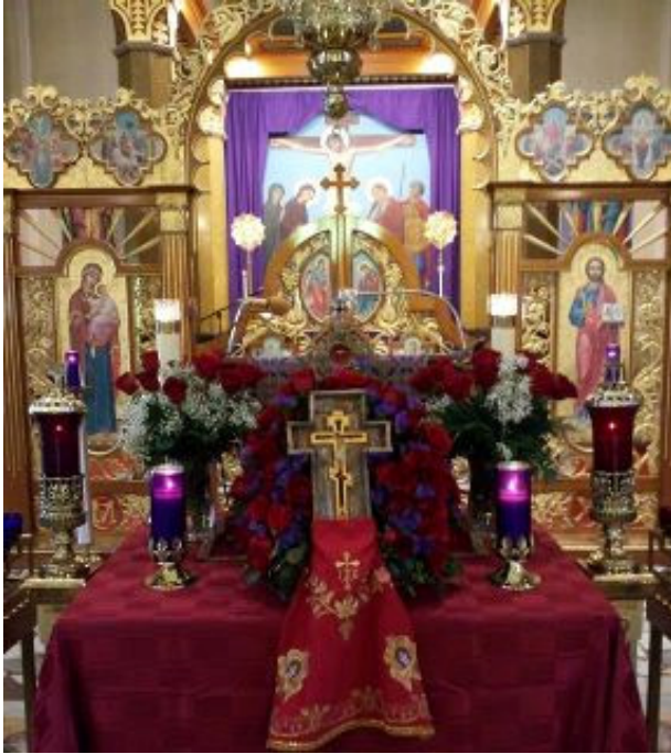
Святий Хрест на тетраподі для вшанування підчас 4-го Тижня Великого Посту, Українська Католицька Церква Святого Володимира, Scranton, PA

Можливо, ви відчуваєте, що Бог кличе вас служити Його Церкві?