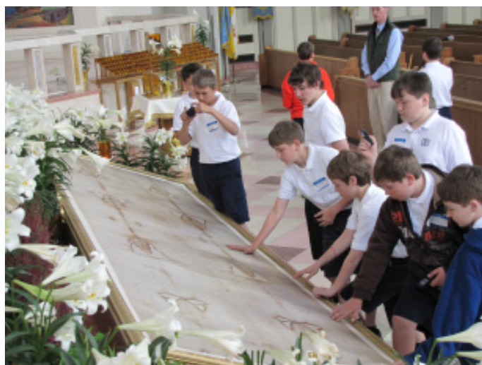
(Photo: Some of the students from Minersville, PA, saw the replica of the Shroud of Turin in 2010 when it was on display at the Cathedral in Philadelphia.)