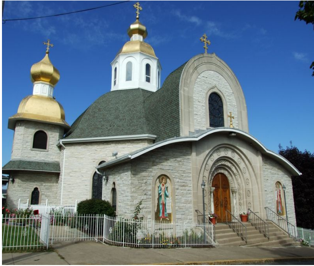
Українська Католицька Церква Св. Михаїла в Шенандоа, ПА

Можливо, ви відчуваєте, що Бог кличе вас служити Його Церкві?