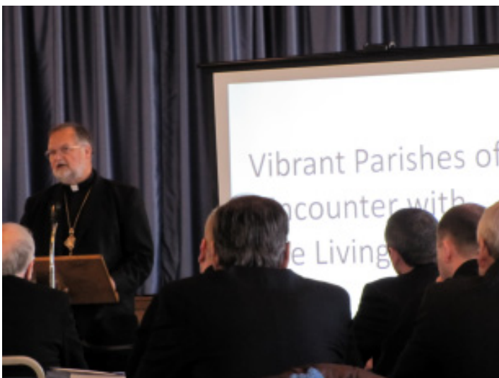
Митрополит-Архиепископ Стефан Сорока розпочав священничу конференцію з привітання і вступної частини про „Візію 2020” “Живі Парафії Місця Зустрічі з Живим Христом.”