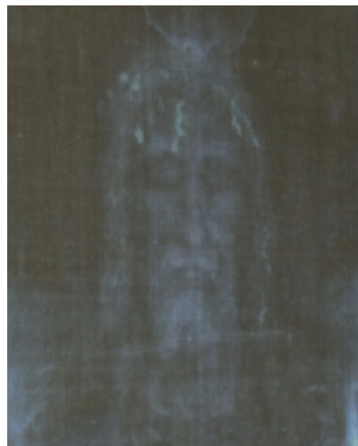
Фото вгорі: Фотографія Копії Туринаської Плащаниці в Українській Католицькій Катедрі Непорочного Зачаття. (2010 р.)