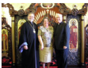
Чарлз і Мері Шульц 44