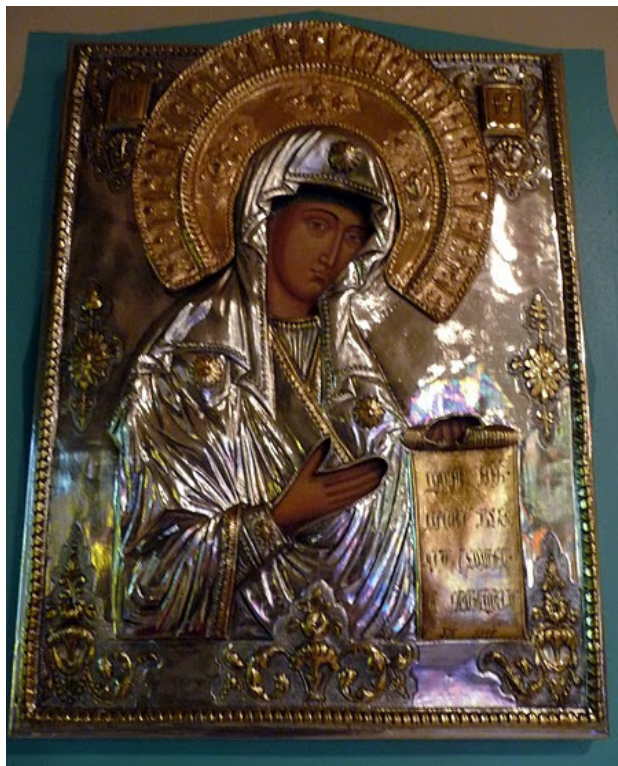
Ікона Богородиці Українська Католицька Церква Благовіщення Пречистої Діви Марії, Мелроуз Парк, ПА