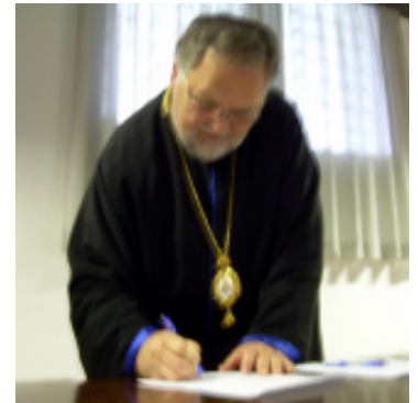
Митрополит Стефан підписує документи при завершенні Собору.