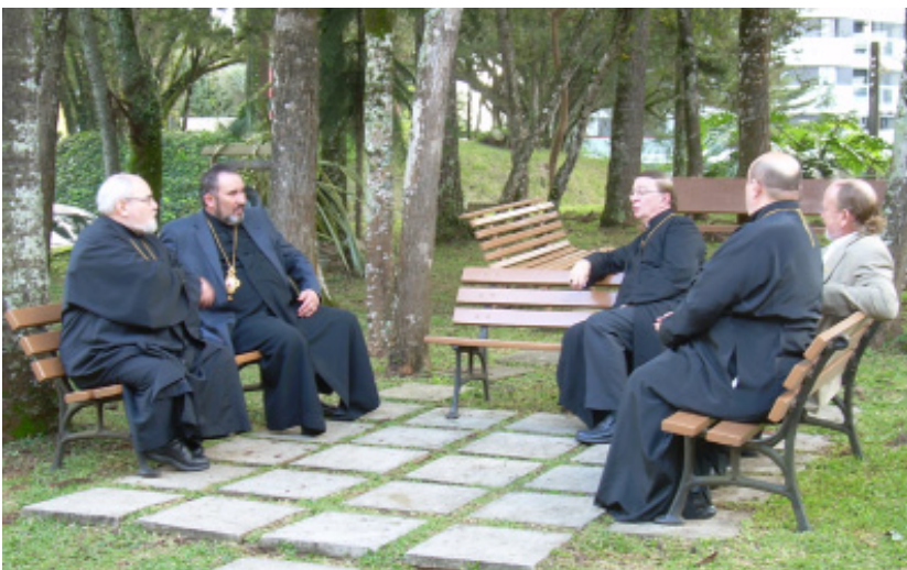
Bishops relax outside of Retreat Center on one of the few days when it did not rain. Spring is approaching at this time of year.