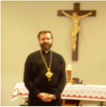
Patriarch Shevchuk addresses bishops in the Chapel.