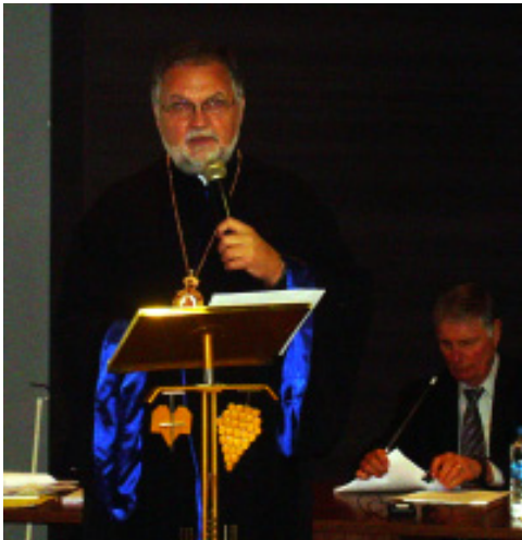
Metropolitan Stefan Soroka introduces the work of the committee planning Vision 2020.