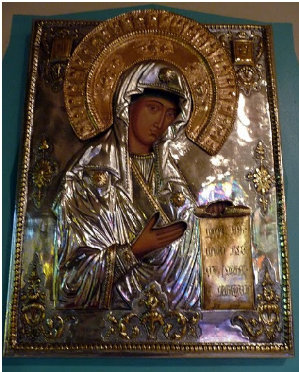
Icon of the Theotokos, Annunciation of the Blessed Virgin Mary Ukrainian Catholic Church, Melrose Park, PA