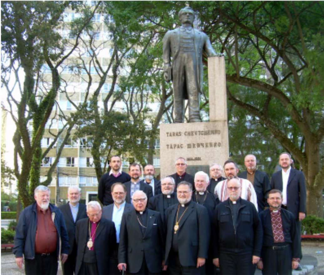
Group of Bishops before Taras Shevchenko statue, Ukrainian Square, Curitiba, Brazil.