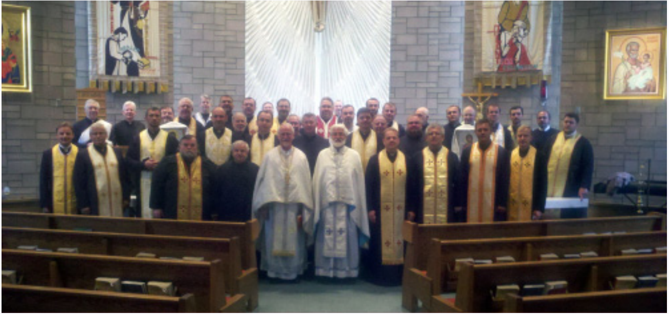
Group photo from the Clergy Retreat in Long Branch, NJ on September 26-29, 2011.