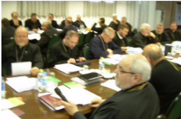
Synod Bishops during one of the eighteen meeting sessions.