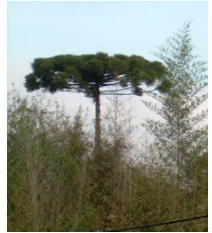
Parana pines, a tree unique to the state of Parana, Brazil, where Ukrainians settled in abundance.