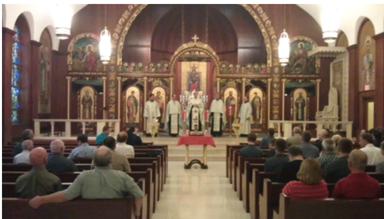
Group picture of the participants of the "Be a Man" Eparchial Day of Reflection, in Stamford, CT. on September 24, 2011.