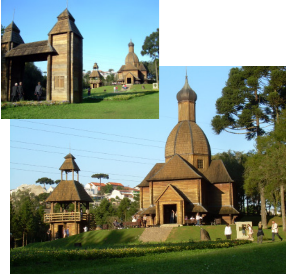
Ukrainian Museum/Ukrainian Park, Curitiba, Brazil Replica of first Ukrainian Church built in the 19 th century.