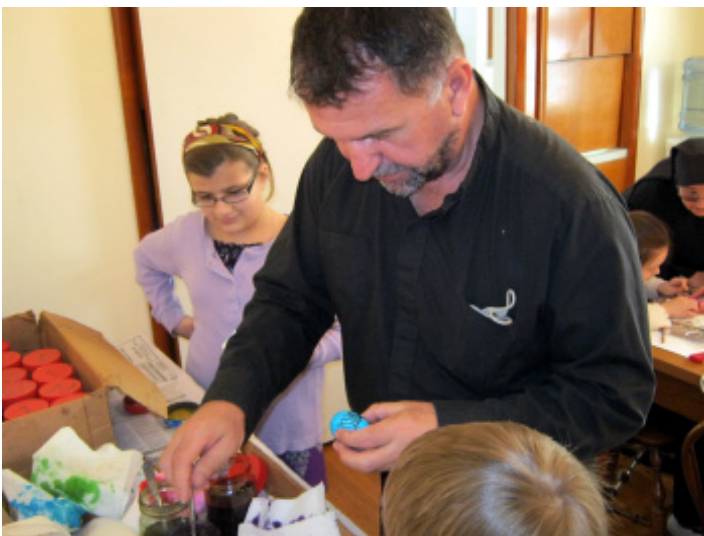
Розпис писанки різними кольорами.