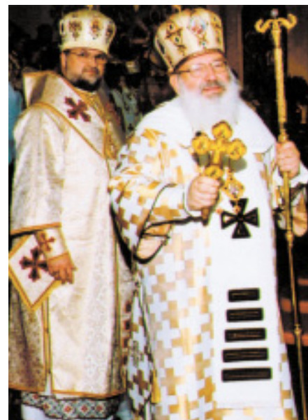
Фото: в Катедрі у Філадельфії, листопад 2002 р.

Серця всіх епархій, духовенства, монашества та вірних нашого Українського Католицького Митрополичого Престолу в Філадельфії вдячні нашому Верховному Архієпископу емериту Любомиру Кардиналу Гузару. Він керував нашою Церквою в важкі часи з Бого-даною мудрістю, прозорливістю, відвагою та делікатністю. Його наполегливість у розвитку візії нашої Церкви буде мати великий позитивний вплив на нашу Церкву впродовж наступних десятиріч. Під його провідом наша Церква повернулася до свого коріння, розбудовує Патріарший Собор і центр в Києві. Любомира Кардинала Гузара цінують всі українці за його мудрість і чесність, необхідні для будь-якого морального провідництва. Ми всі сподіваємося, що він продовжить своє корисне та потрібне служіння уже як Верховний Архієпископ на емеритурі й залишиться жити в Києві.