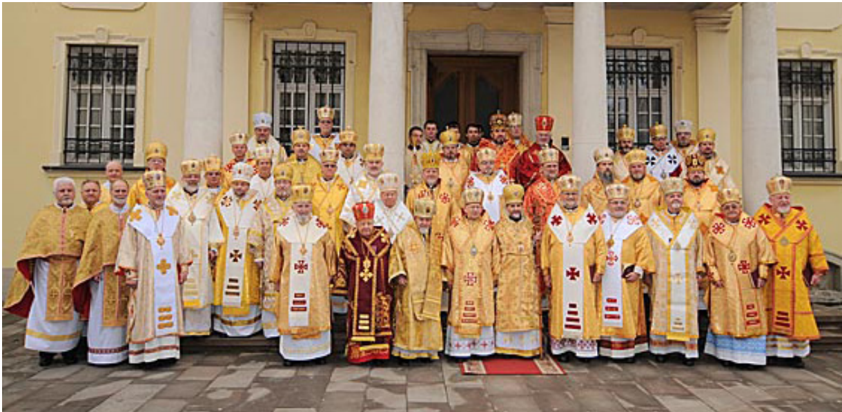
Загальне фото біля катедри Святого Юра.

Владика помолилися у крипті собору Святого Юра, де спочивають тлінні останки трьох провідників УГКЦ у минулому столітті: Митрополита Андрея (Шептицького), Патріарха Йосифа (Сліпого) та Патріарха Мирослава Івана (Любачівського).