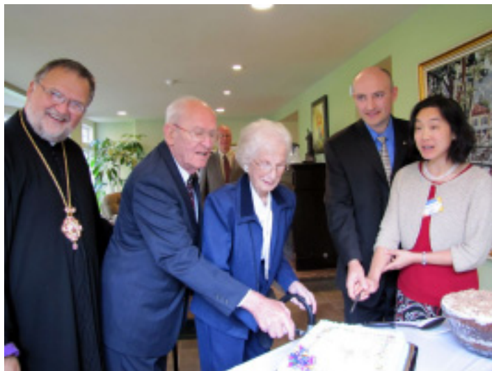
Ювіляри розрізують торт.

Відео і фотографії з Святкування Річниць дивіться на нашому blog: