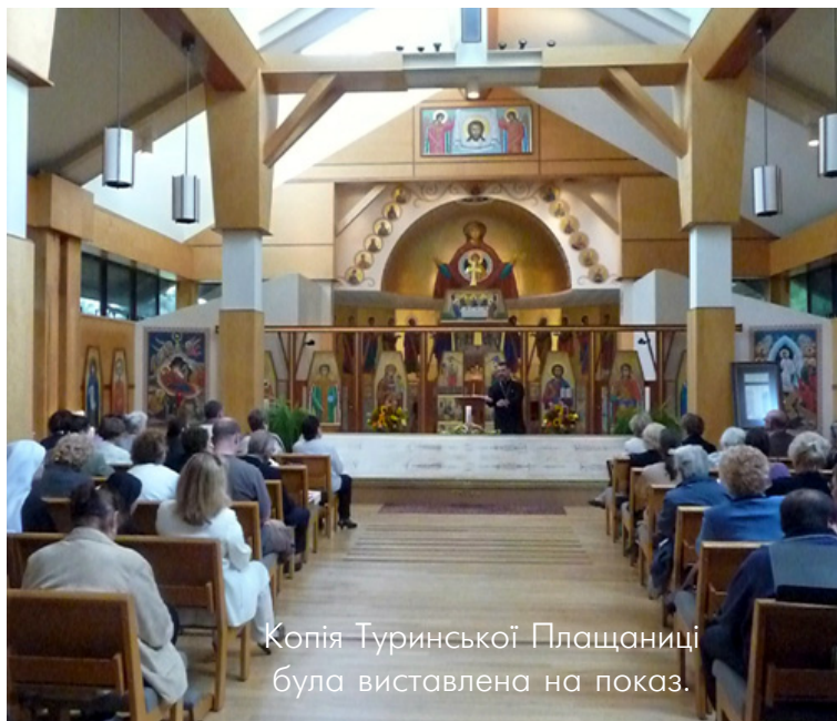
Копія Туринської Плащаниці була виставлена на показ.

Іншою чудовою і подивугідною рисою цьогорічної прощі була „Свічка Молитви“, яка яскраво горіла в каплиці Пресвятої Трійці, збираючи побожний нарід на протязі вихідних днів. Свічка, надіслана Сестрам Святого Василя Великого Українським Світовим Конгресом в співпраці з Українським Інститутом Національної Пам'яті вирушає до 32 країн, де вона горітиме в пам'ять жертв українського великого голоду - Голодомору 1932-1933 рр.