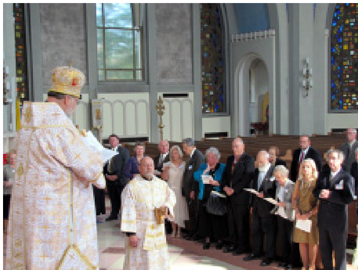
Ювіляри поновлюють шлюбну присягу.