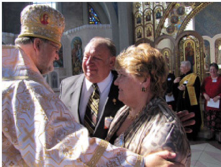
Архієпископ Стефан благословляє пари.